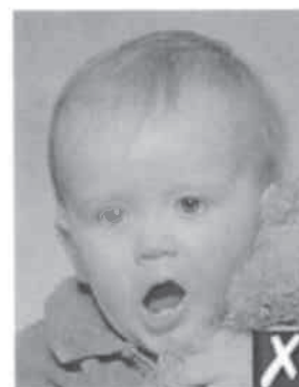
bocca aperta e gioco troppo vicino al viso