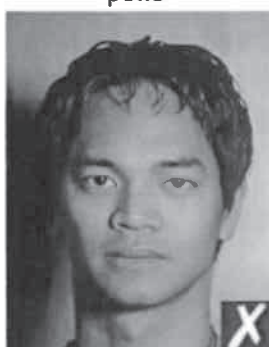
ombre dietro la testa