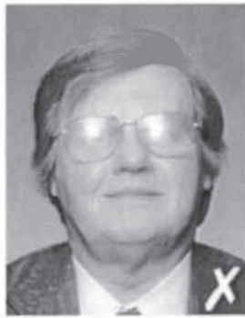
riflesso del flash sulle lenti