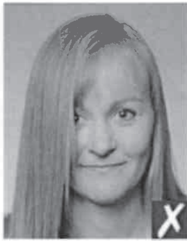
capelli davanti agli occhi