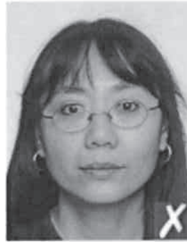
montatura sugli occhi