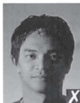
ombre sul viso