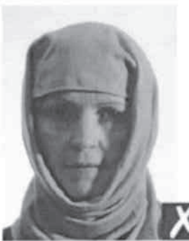
ombre sul viso