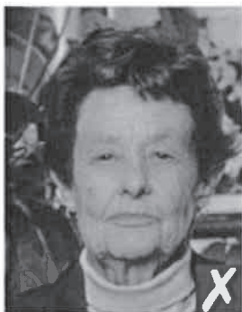
sfondo non uniforme