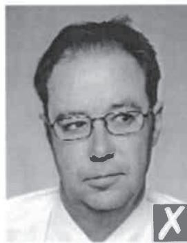
guarda di lato