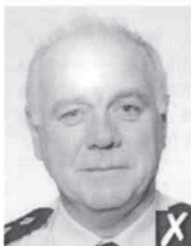
riflesso del flash sulla pelle