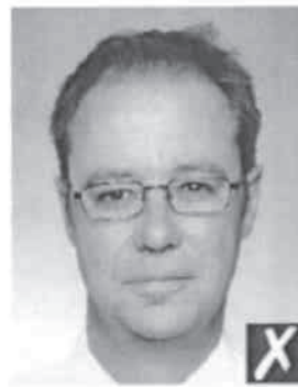
colore della pelle non naturale