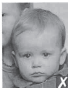
con un'altra persona

La fotografia deve mostrarti da solo (senza sedie, giochi o altre persone visibili), devi guardare l'obiettivo con un'espressione naturale e con la bocca chiusa.