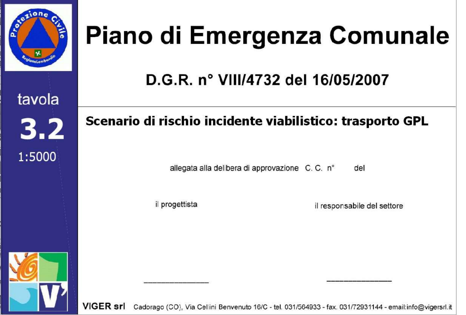
tavola 3.2 1:5000